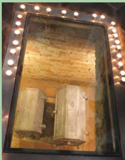
Krypta s ostatky posledních Sternbergů: Arcibiskupa Alberta II., synovce Petra a jeho ženy Rebeky z Kravař.

zádušní mše, a na příslušníky českého šlechtického rodu bude vzpomenuáno při bohoslužbě za zemřelé. Pořádání Dnů rodu Sternbergů má své kořeny v události, která se odehrála