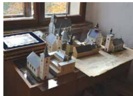
Mezi papírovými maketami historických budov je mj. i komplex Šternberského kláštera.